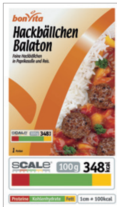
Abb. 3: sCALe auf einer Produkt-Verpackung (vergrößert abgebildet)

Beim Eingangsscheck wird der persönliche Status quo des Mitgliedes ermittelt. Auf dieser Basis wird gemeinsam das Trainingskonzept erstellt. Häufig wird eine Zielsetzung definiert; zumeist erfolgt diese auch in Form eines „Zielgewichtes“ – ein entscheidender Fehler. Denn dass eine Gewichtsangabe kein Qualitätsmerkmal ist, dessen Erreichung anzustreben wäre, ist mittlerweile bekannt.